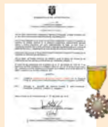
ORDEN NACIONAL AL MÉRITO PRESIDENCIA DE LA REPÚBLICA (2010)