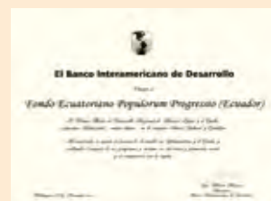
PREMIO MÉRITO AL DESARROLLO REGIONAL DE AMÉRICA LATINA Y EL CARIBE, "JUSCELINO KUBITSCHKE" EN LA CATEGORÍA SOCIAL, CULTURAL Y CIENTÍFICA (2015)