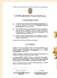
AL MÉRITO SOCIAL H. CONGRESO NACIONAL DEL ECUADOR (2005)